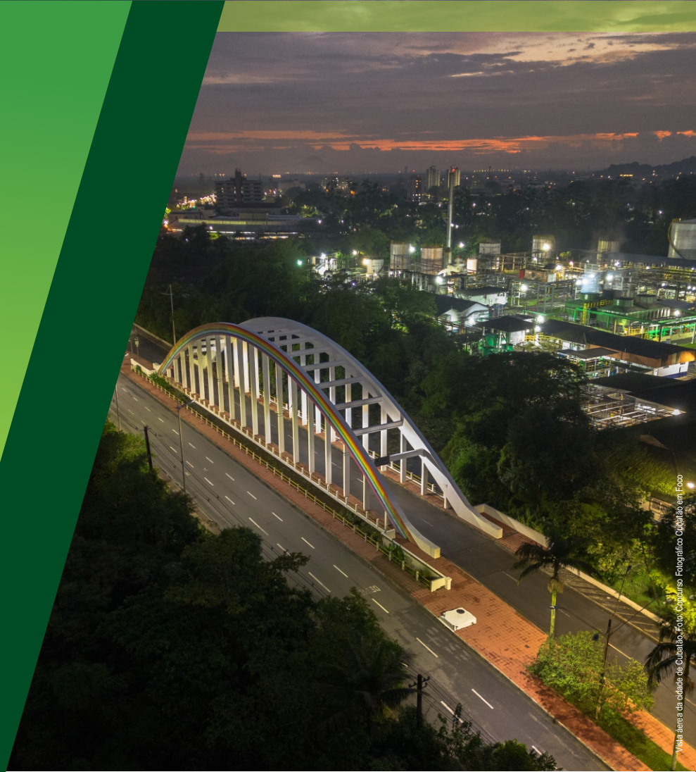
Visão aérea da cidade de Cubatão.